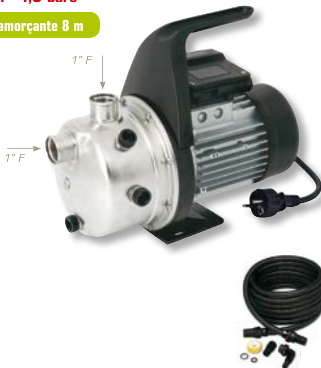
Kit d'aspiration 7m

Les pictogrammes facilitent le choix des produits à partir de données généralisées. Toute configuration différente doit être étudiée de façon personnalisée