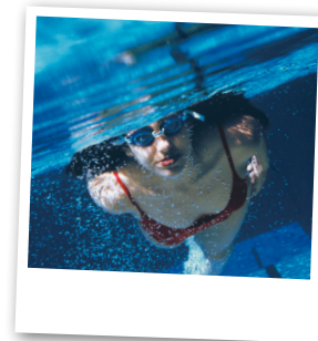
Kit de nage à contre-courant